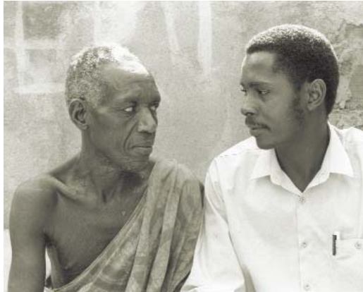
Un voluntario de la lucha contra el VIH/SIDA visita a un enfermo en su casa en una aldea próxima a Kampala (Uganda)