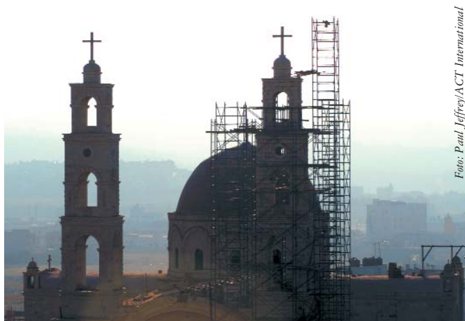
En la ciudad palestina de Nablus, se está reconstruyendo la Iglesia Ortodoxa Griega en el pozo de Jacob

El Programa Ecuménico de Acompañamiento en Palestina e Israel (PEAPI) es un ejemplo destacado de cómo el CMI combina en su trabajo los planos local y mundial. Empezado en 2002, el PEAPI consiste en acompañar a palestinos e israelíes en sus acciones no violentas y en sus esfuerzos concertados para poner fin a la ocupación ilegal de Cisjordania. Apoyados