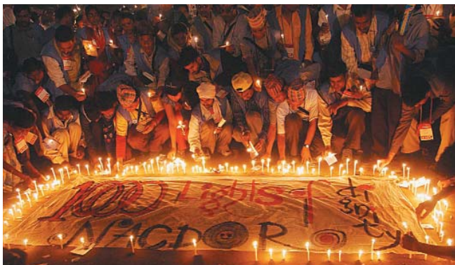
Los dalits de la Conferencia Nacional de Organizaciones Dalit (NACDOR) en el Foro Social Mundial encienden velas sobre una pancarta en la que reivindican su dignidad

Un festivo servicio de culto inaugural, seminarios concurrecidos y camisetas especiales de colores fueron algunos de los signos visibles de una fuerte presencia ecuménica en el cuarto Foro Social Mundial celebrado en Mumbai (India), del 16 al 21 de enero.