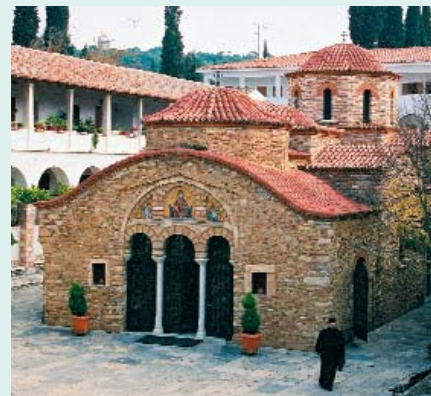
El monasterio de Pendeli, en las afueras de Atenas, acogió del 24 al 28 de noviembre una reunión del Comité de Planificación de la Conferencia

Están terminándose los planes para la Conferencia Mundial sobre Misión y Evangelización (CMME), que tendrá lugar en Atenas (Grecia), del 9 al 16 de mayo de 2005, antes de lo previsto originalmente.