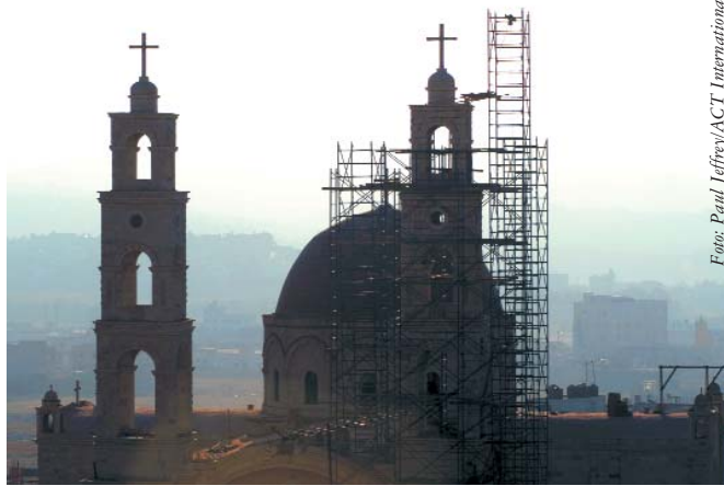
Wiederaufbau der griechisch-orthodoxe Kirche am Jakobsbrunnen in der palästinensischen Stadt Nablus.

Das Ökumenische Begleitprogramm in Palästina und Israel (EAPPI) ist ein signifikantes Beispiel dafür, wie der ÖRK seine Arbeit auf lokaler und globaler Ebene miteinander verbindet. Das 2002 gestartete EAPPI-Programm begleitet Palästinenser und Israelis, die sich mit gewaltfreien Aktionen und konzentrierten Fürsprachebemühungen für eine Beendigung der rechtswidrigen Besetzung des