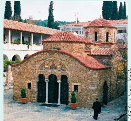
Das Pendeli-Kloster vor den Toren Athens, wo vom 24.-28. November 2003 der Planungsausschuss für die Konferenz tagte.

Die Planung der Konferenz für Weltmission und Evangelisation (CWME), die vom 9.-16. Mai 2005 – und damit einige Tage früher als ursprünglich geplant – in Athen, Griechenland, stattfinden wird, tritt in ihre Endphase. Dies wird die sechste Weltmissionskonferenz sein, die seit der Integration des Internationalen Missionsrats in den ÖRK 1961 veranstaltet wird, und die erste, die in einem vorwiegend orthodoxen Umfeld stattfindet.