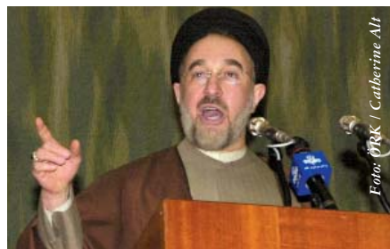
Präsident Khatami äußert sich bei einer öffentlichen Ansprache im Ökumenischen Zentrum zum religiösen Dialog und zu internationalen Beziehungen.

http://www.wcc-coe.org/wcc/what/interreligious/khatami-anchor.html