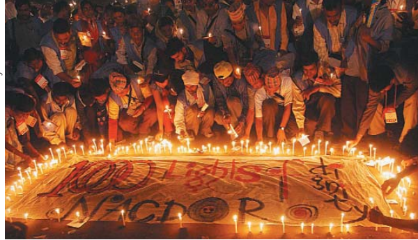
Dalits von der Nationalkonferenz der Dalit-Organisationen (NACDOR) zünden beim Weltsozialforum Kerzen an, die ein Banner beleuchten sollen, auf dem die Würde der Dalits eingefordert wird.

Ein festlicher Eröffnungsgottesdienst, vollbesetzte Seminare und speziell angefertigte bunte T-Shirts waren einige der äußeren Zeichen, die sichtbar machten, dass die Ökumene auf dem vierten Weltsozialforum vom 16.-21. Januar in Mumbai, Indien, sehr präsent war. In Mumbai gab es mehr kirchliche Teilnehmer und Teilnehmerinnen als auf irgendeiner der drei vorhergehenden Tagungen des Weltsozialforums in Porto Alegre. Basisgruppen und –gemeinschaften, die zumeist vom indischen Subkontinent kamen, waren massiv vertreten und verliehen dem WSF 2004 zum ersten Mal eine volksnahe Atmosphäre.